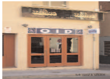
Sede central de AZEHOS

pero el Gobierno tiene dos caras en el tema, por un lado dice que debemos dejar de fumar pero por otro se beneficia con los impuestos, por lo que en el fondo no creo que deseen el final del tabaco. Y por otro lado están las tabacaleras, que tienen