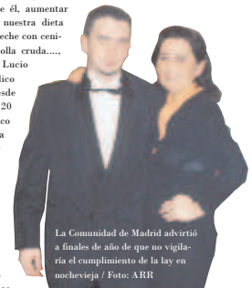
La Comunidad de Madrid advirtió a finales de año de que no vigilaría el cumplimiento de la ley en mochevieja