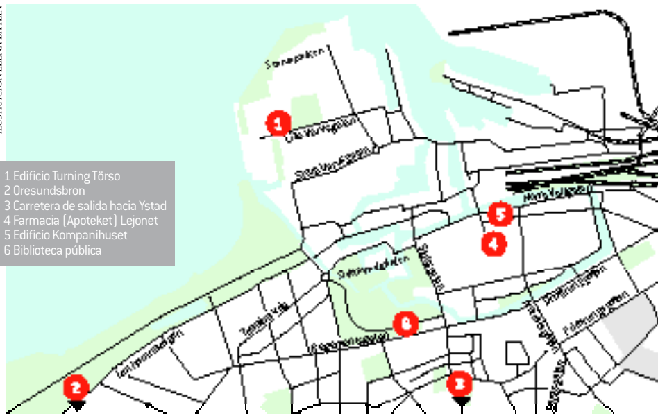
ILUSTRACIÓN ELENA BAYLÍN